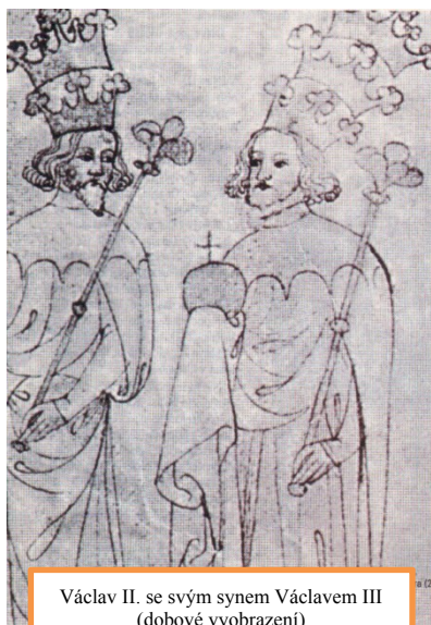
Václav II. se svým synem Václavem III. (dobové vyobrazení)